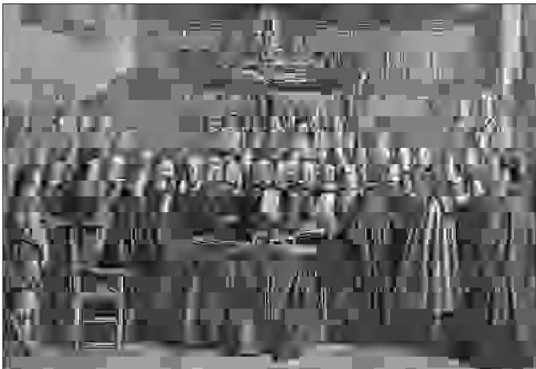
Firma de la Paz de Westfalia (ilustración de Terburg)

La última función es, notablemente, la más peligrosa, ya que al oscurecer el carácter de clase del Estado la territorialidad moderna logra que todos los habitantes de un territorio se conviertan en «nacionales» de un Estado-nación y se identifiquen con él. De este modo se produce una fuerte legitimación de las guerras, que se convierten en «guerras populares» so pretexto de defensa del territorio nacional.